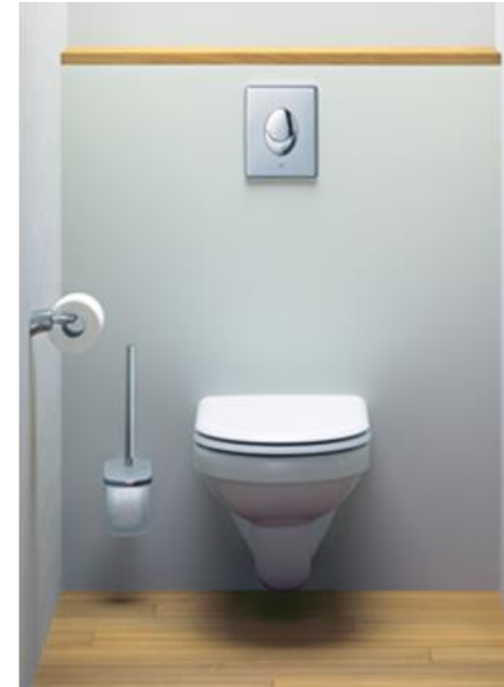
Bâti support encastré avec plaque de commande