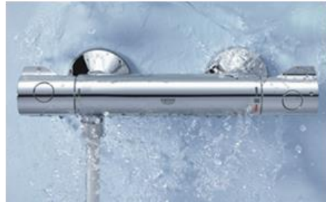
Thermostatique G800 avec poignées ergonomiques