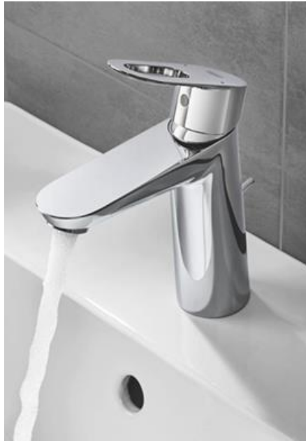
Gamme BAULOOP Poignée avec levier étrier